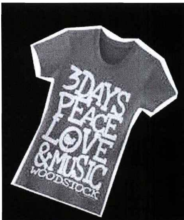
Tee-shirt édité à l'occasion des 40 ans de Woodstock

Le Before by July compte aussi mettre l'accent sur l'arrivée des marques de "cocktail de jour". En effet, si le jean, la veste noire et la chemise restent sans conteste des basiques en journée, le vestiaire jour tend de plus en plus à emprunter à celui du soir. Un genre nouveau est annoncé que l'on devrait bien entendu constater sur place, entre programmations musicales et artistiques placées sous le signe du festival de Woodstock qui fête cette année ces 40 ans.